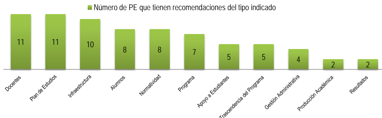
Gráfica 1. Recomendaciones CIEES

De los 15 Programas de Licenciatura de la DES Xalapa, 13 cuentan con el nivel 1; los CIEES han emitido recomendaciones que han podido atender a corto y mediano plazo, sin embargo aún existen algunas que por ser de carácter disciplinario, normativo o de infraestructura requieren más de un análisis o del recurso económico para la atención de éstas.